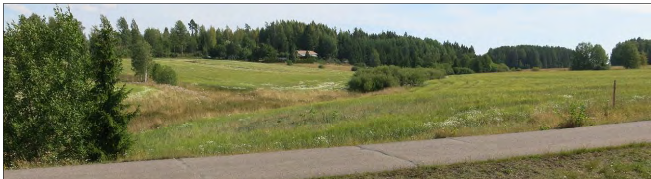
Kuvio 5 Kirkkotien suunnasta

Kuviot 5. Ojanvarren avoin osuus (länsipää). Kuviolla yhtyy kaksi oja- tai puronotkelmaa, joissa kasvaa pohjalla kosteaa suurruohoniittyä, ylempänä tuoretta niittyä. Valtalajistossa alempana etenkin mesiangervo, ylempänä kookkaat heinät.