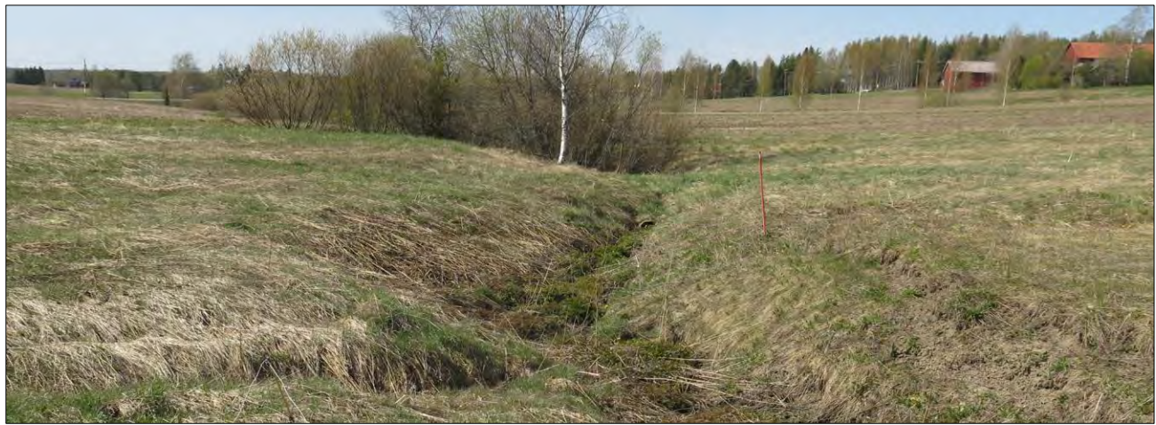
Kuvion 4 puronotkelma

Kuvio 4. Ojanvarren pensaikkoinen osuus. Vallitsevat lajit kiiltopaju ja tuomi. Lisäksi kasvaa muita pajulajeja sekä itäosassa joitain kuusen, männyn ja koivun taimia.