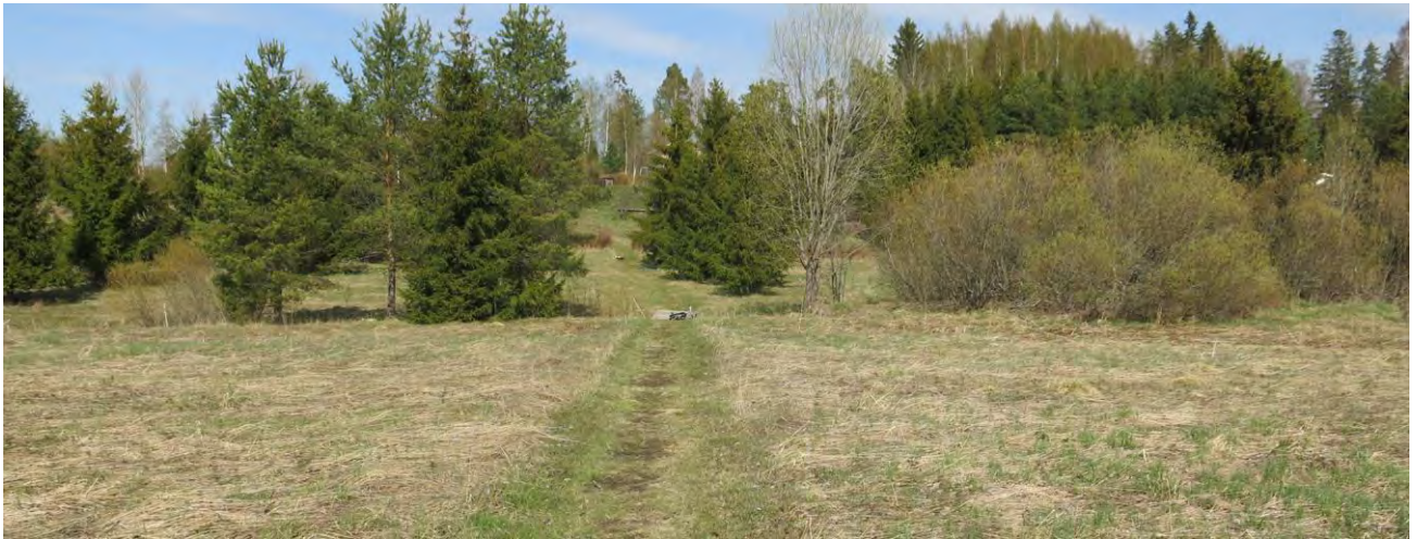
Kuvion 2 niittyä