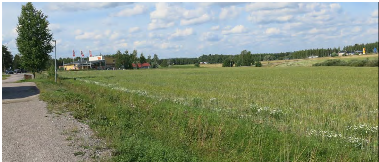
Kuvio 3 paloaseman pihalta Vältien suuntaan

Kuvio 3. Harattu pelto, jota ei kuitenkaan ole kylvetty.