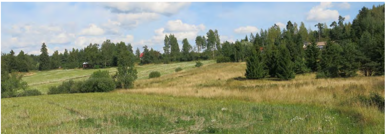
Etualalla kuvio 2. Taustalla ojan pohjoispuolen peltoa ja niittyä

Kuvio 3. Harattu pelto, jota ei kuitenkaan ole kylvetty.