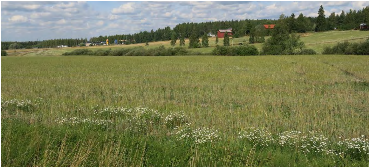
Kuvio 3 Välitien suunnasta. Taustalla ojanvarren pensasvyöhyke

Kuvio 4. Ojanvarren pensaikkoinen osuus. Vallitsevat lajit kiiltopaju ja tuomi. Lisäksi kasvaa muita pajulajeja sekä itäosassa joitain kuusen, männyn ja koivun taimia.